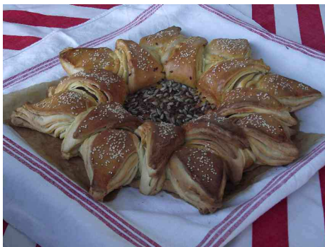
Borraforgó (Igazi név a Venyánál!)